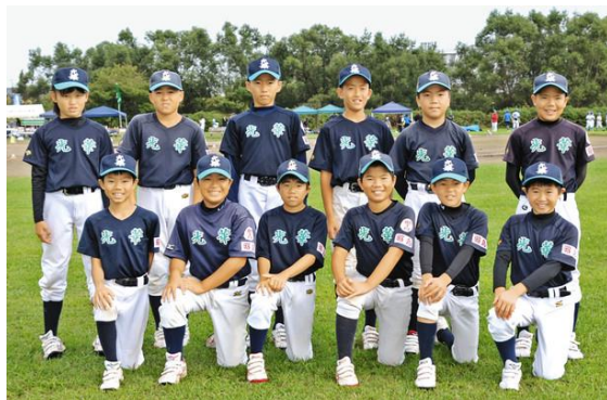
惜しくも 準優勝 光華グリーンズ

予選リーグ0勝ながら決勝Tに進出し 決勝戦では、6年生チーム相手に 最後まで粘り苦しみ…… 堂々たる準優勝