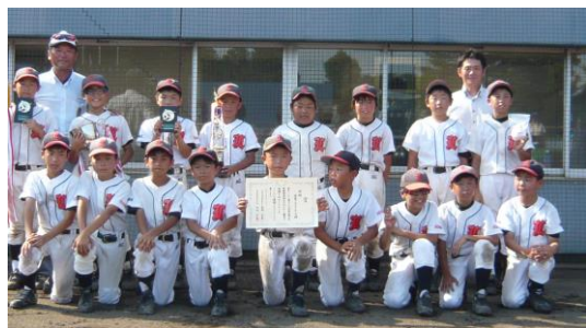
今回もあと一步 第3位 昭島ヤングライオンズ 写真は、防犯大会での1コマ

中学に行っても好きな事に 全力で頑張ってください。 身体を大切に!! 感謝の気持ちを忘れずに!