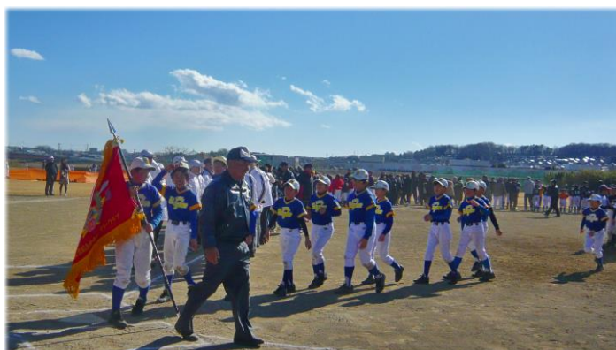
本年度V5 優勝 昭島リトルイーグルス 優勝旗を先頭に

本年度 6年生の大会は、6回有りましたが 本大会では、最終回しっかり守り抜き接戦を 制しての本年度の5度目の頂点