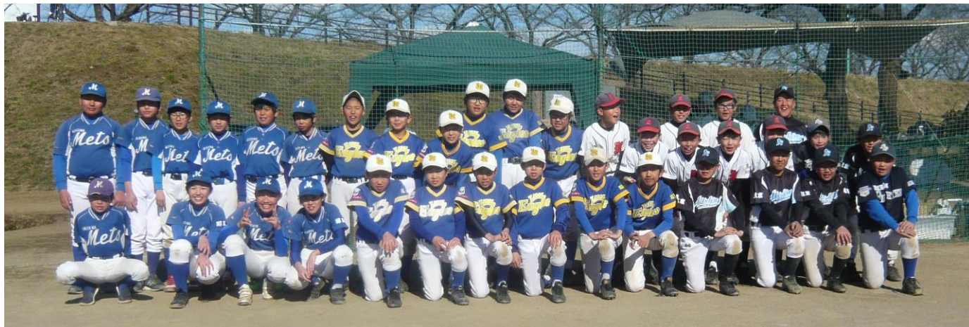
36名の6年生全員での記念写真 小学生では、ライバルも中学校でチームメイト?