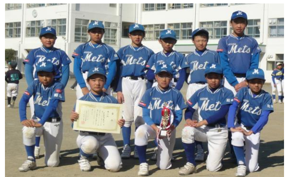
第3位 昭島美堀メッツ

※本年度 昭島少年野球連盟主催大会 6年の部 春季・ジャビットカップ昭島大会優勝 第3位 4回